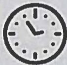
ГРАФИК РАБОТЫ УЧАСТКОВ ДЛЯ ГОЛОСОВАНИЯ

Каждый участник референдума голосует лично.